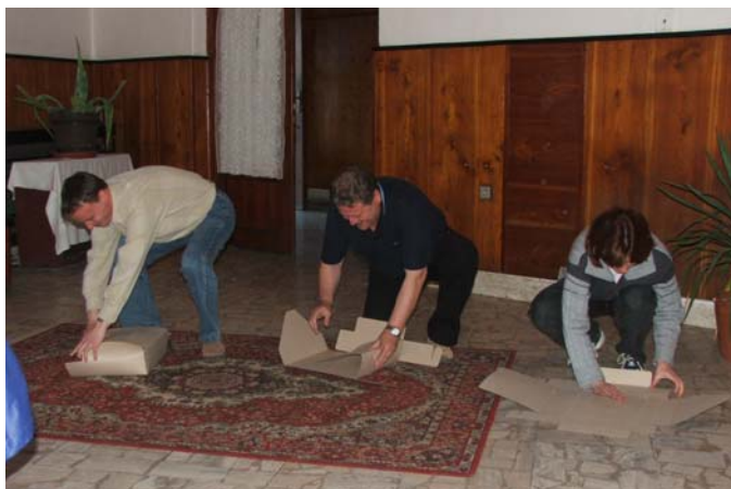
V Levoči sa súťažilo napríklad aj v skladaní archívnych škatúl

Na záver mi dovoľte zopakovať a trochu doplniť pranie z putovnej kroniky, ktorou sa začínal prvý seminár: „aby sa tento (v poradí už šiesty) archívny počin vydaril“ aspoň tak dobre ako tých päť predchádzajúcich.