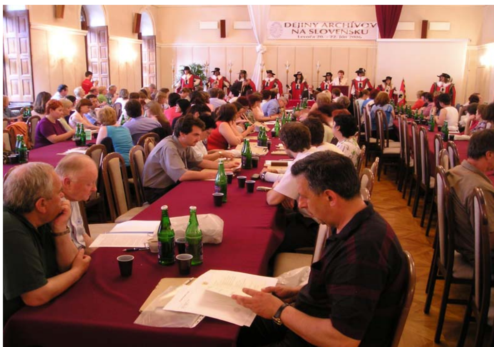
X. archívne dni v Levoči